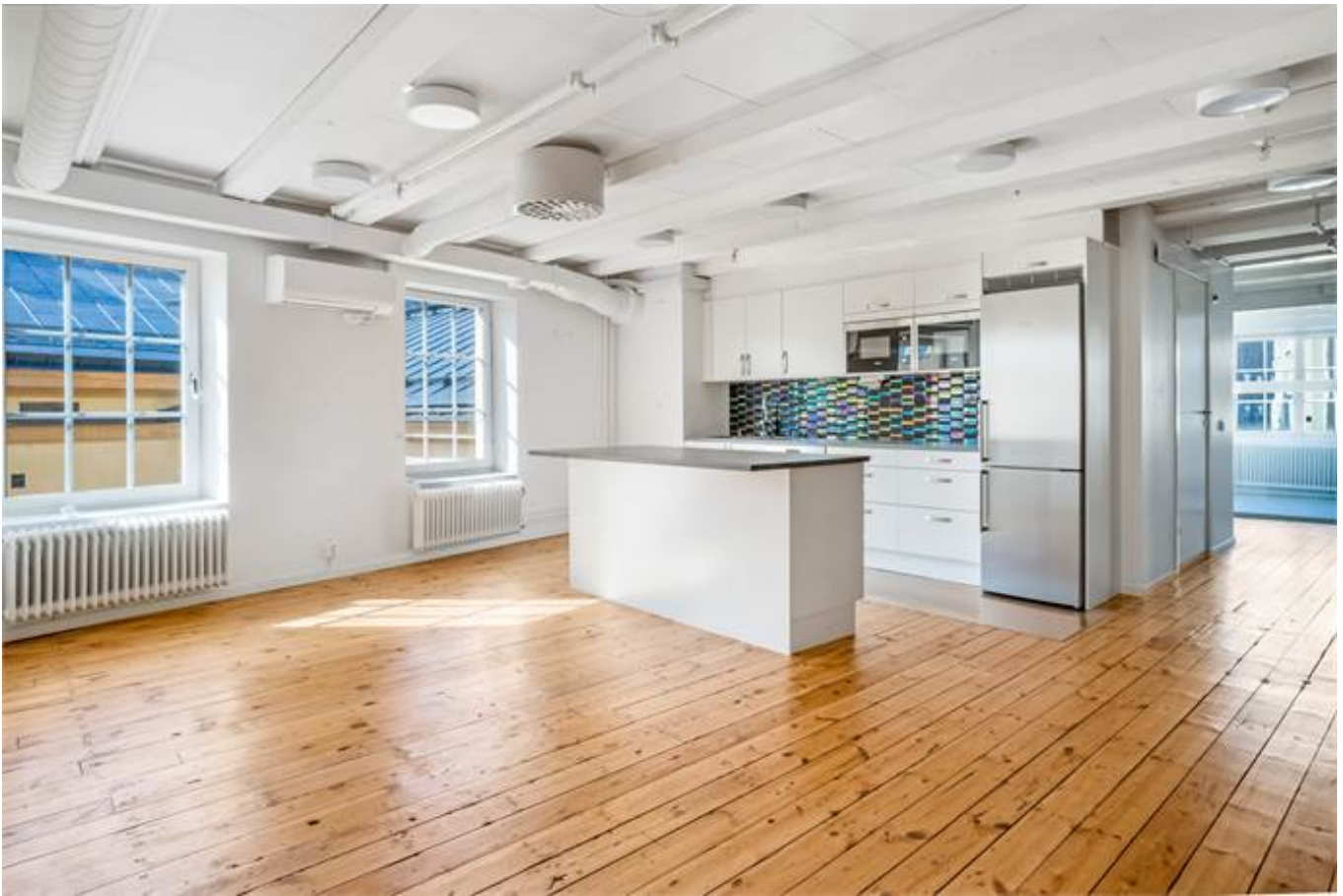
Järnbrogatan 3A, Centralt Knäppingsborg, Norrköping - Kontor