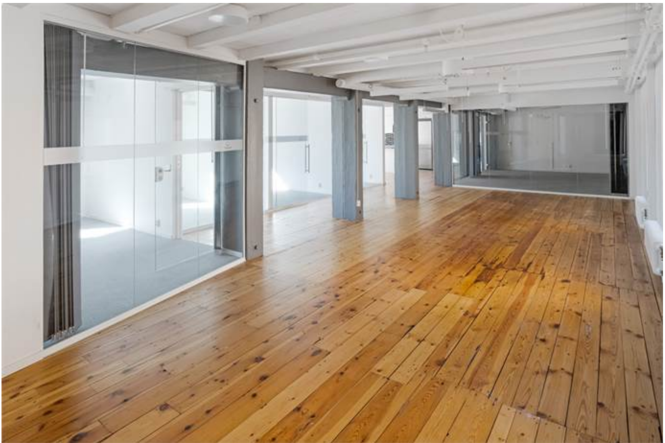
Järnbrogatan 3A, Centralt Knäppingsborg, Norrköping - Kontor