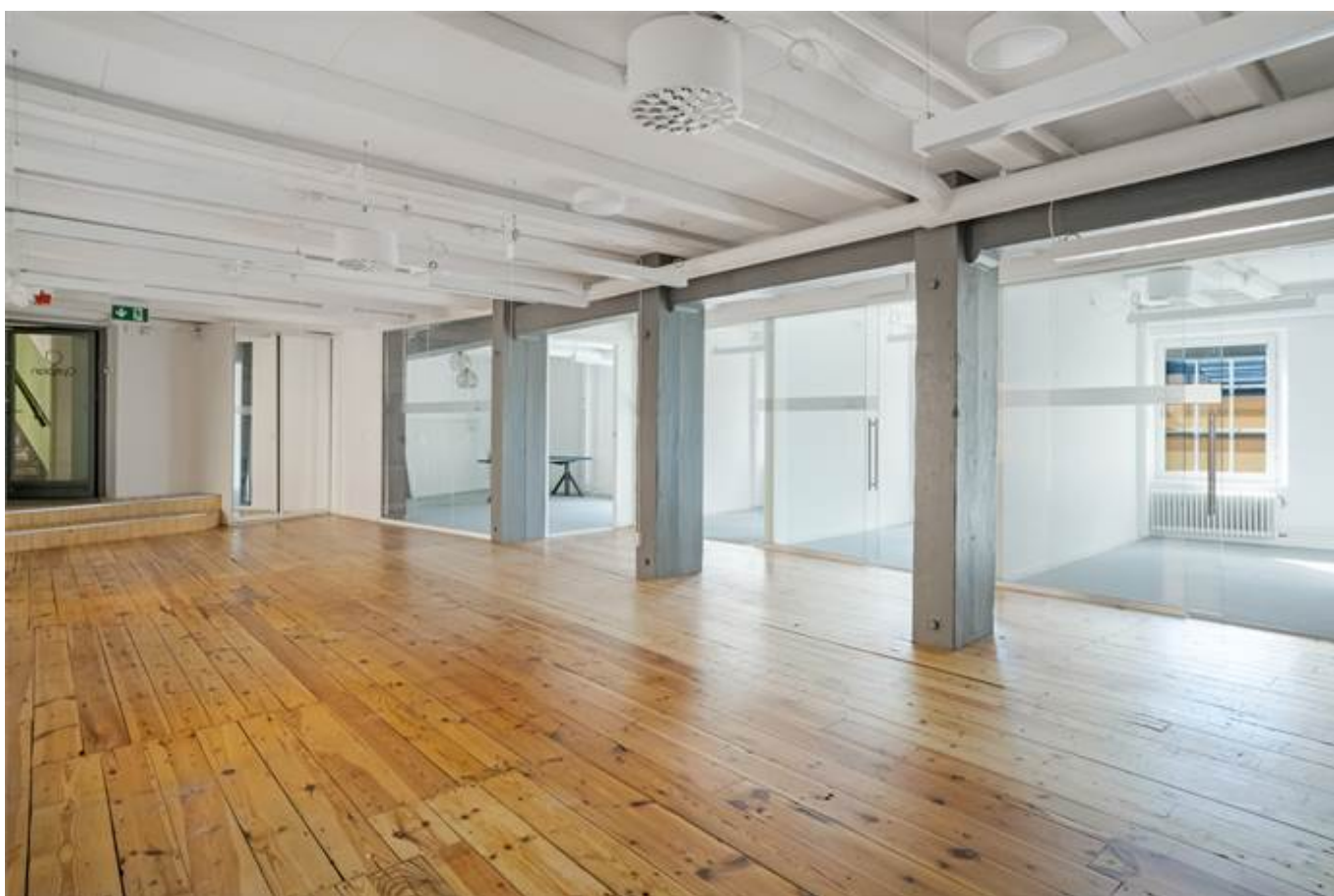
Järnbrogatan 3A, Centralt Knäppingsborg, Norrköping - Kontor