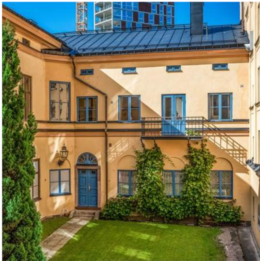
Järnbrogatan 3A, Centralt Knäppingsborg, Norrköping - Kontor