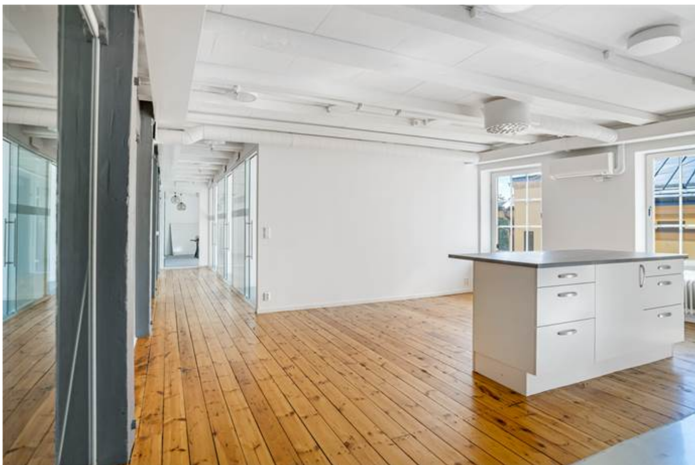
Järnbrogatan 3A, Centralt Knäppingsborg, Norrköping - Kontor