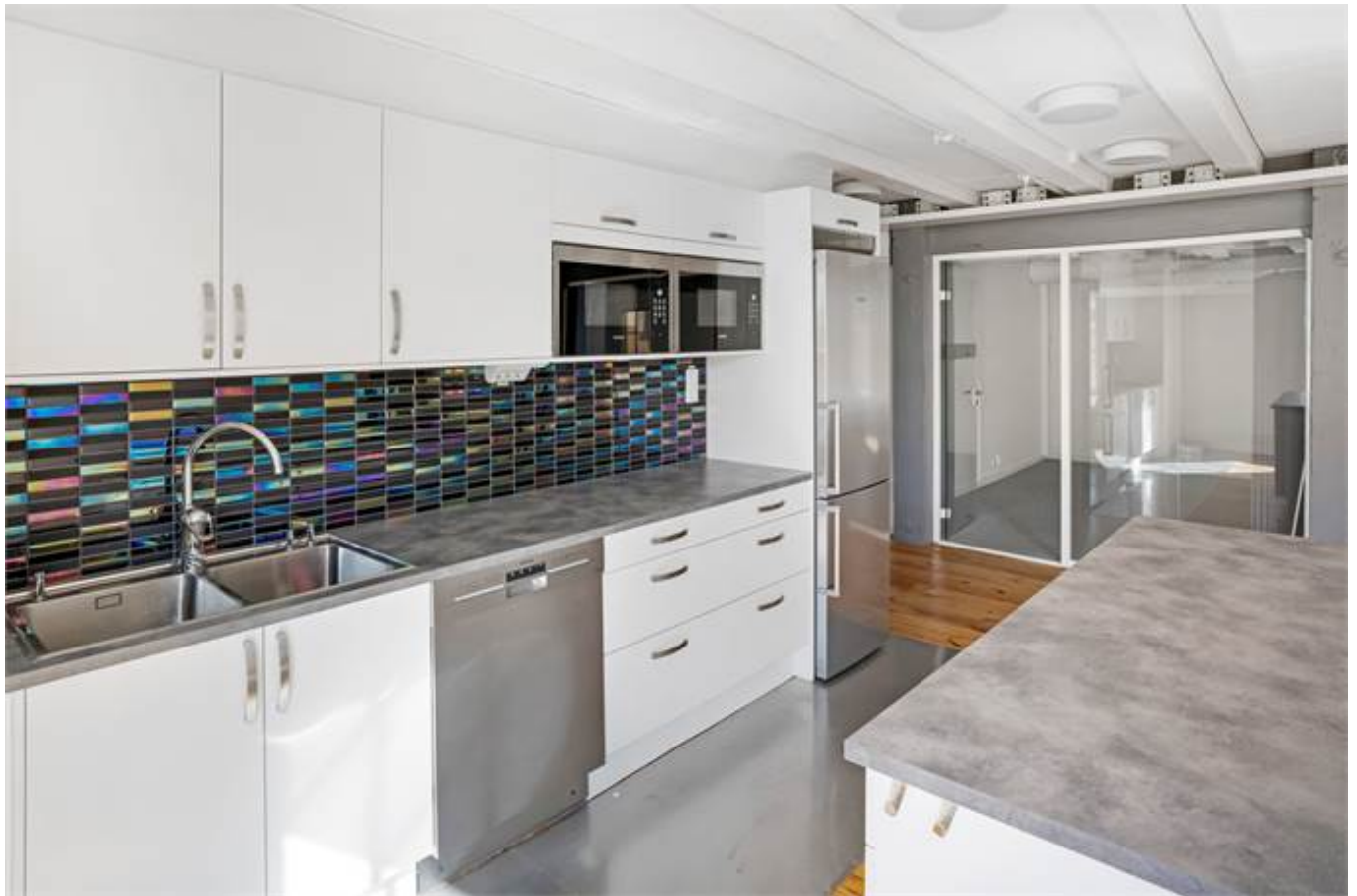
Järnbrogatan 3A, Centralt Knäppingsborg, Norrköping - Kontor