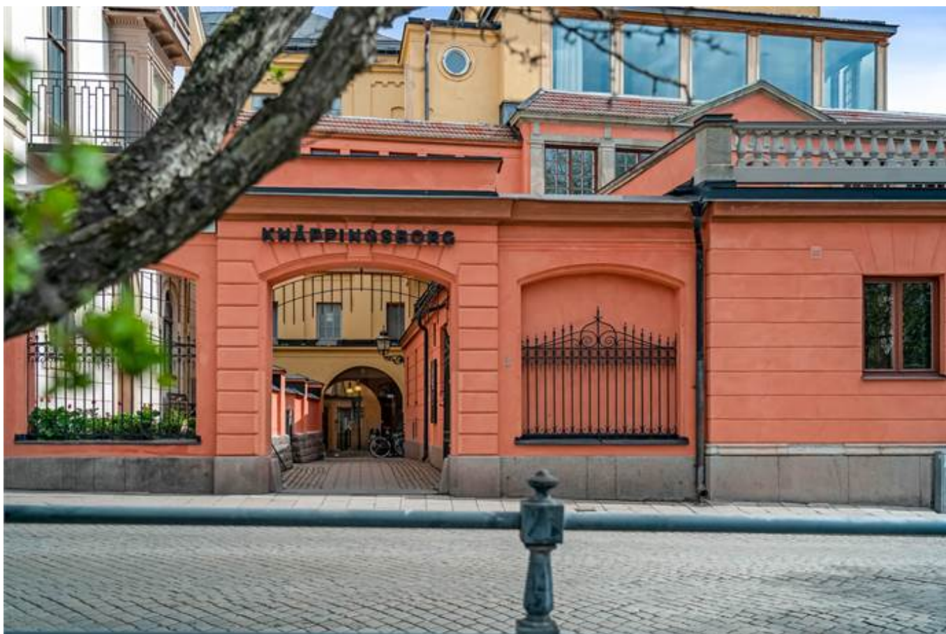
Järnbrogatan 3A, Centralt Knäppingsborg, Norrköping - Kontor