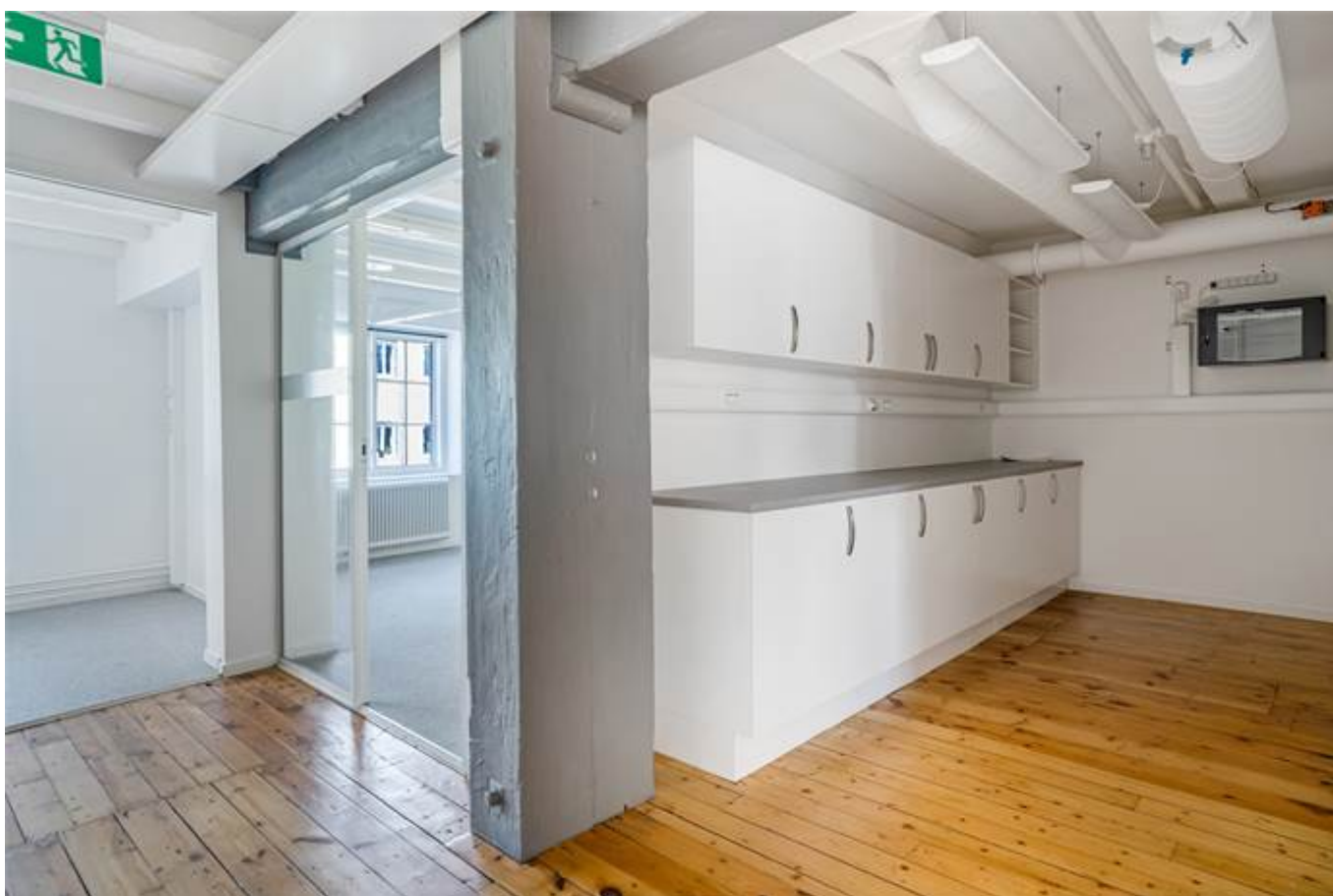
Järnbrogatan 3A, Centralt Knäppingsborg, Norrköping - Kontor