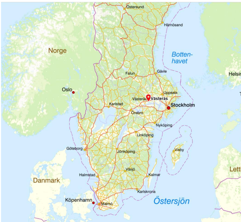
Figur 1: Karta över elnätets geografiska lokalisering.

Figur 1 visar en mer utzoomad bild på området för att ge läsaren en bättre överblick över i vilken del av landet företags elnät finns.