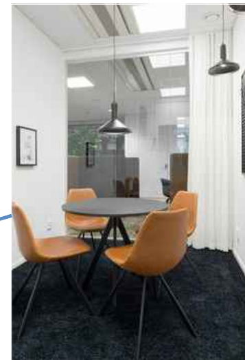
Inspirationbild - Samtal 4 pl