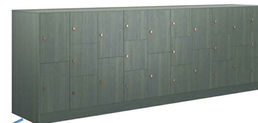
Inspirationbild - Personlig förvaring