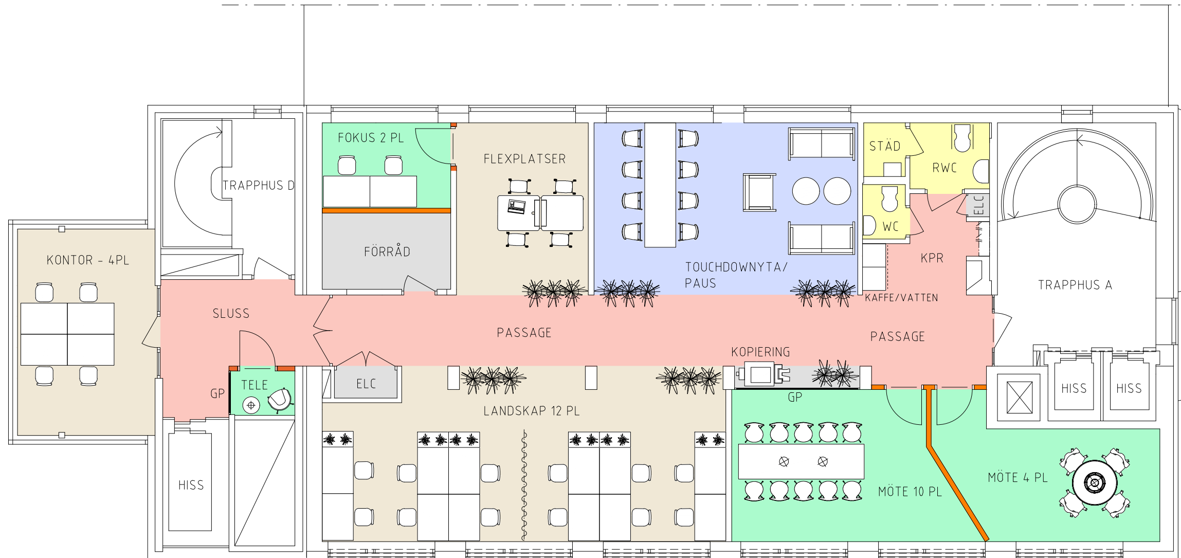
PLAN 6 TR.

Denna ritning bygger på ett äldre ritningsunderlag. Ingen detaljmätning har utförts. Avvikelser kan förekomma