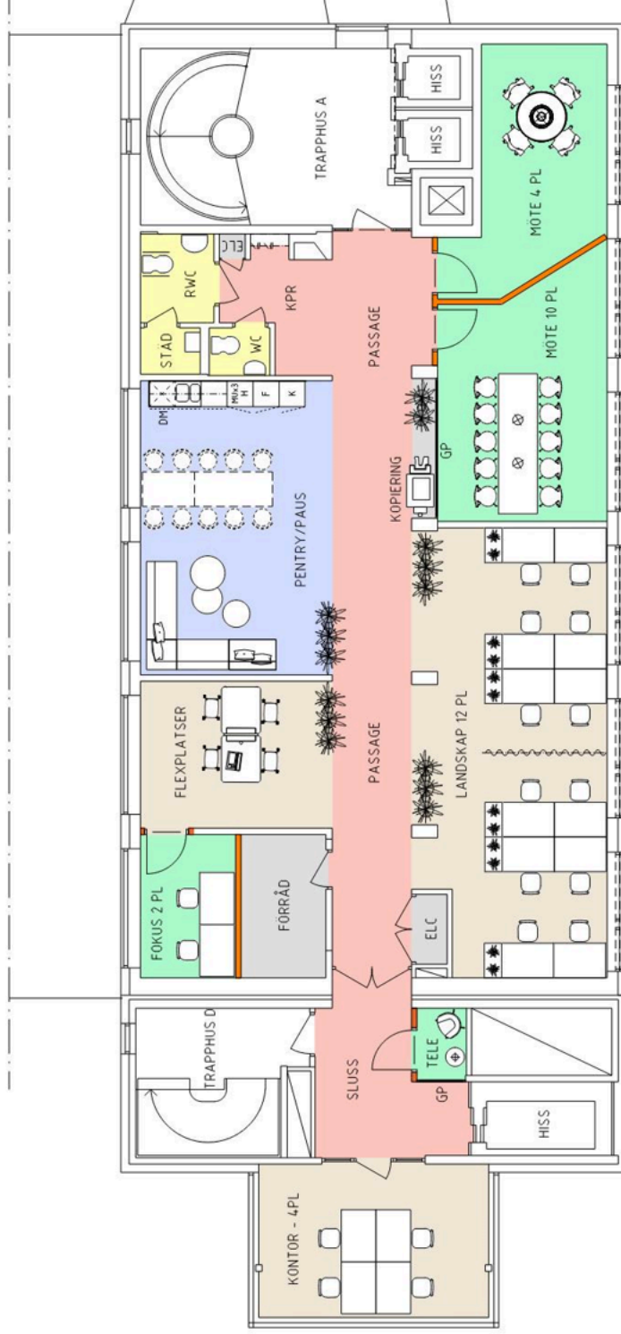
PLAN 6 TR

DENNA RITNING BYGGER PÅ ETT ALDRE RITNINGUNDERLAG. INGEN DETALJINRIKNING HAR UTFÖRTS. ÄVVKELSER KAN FÖREKOMMA