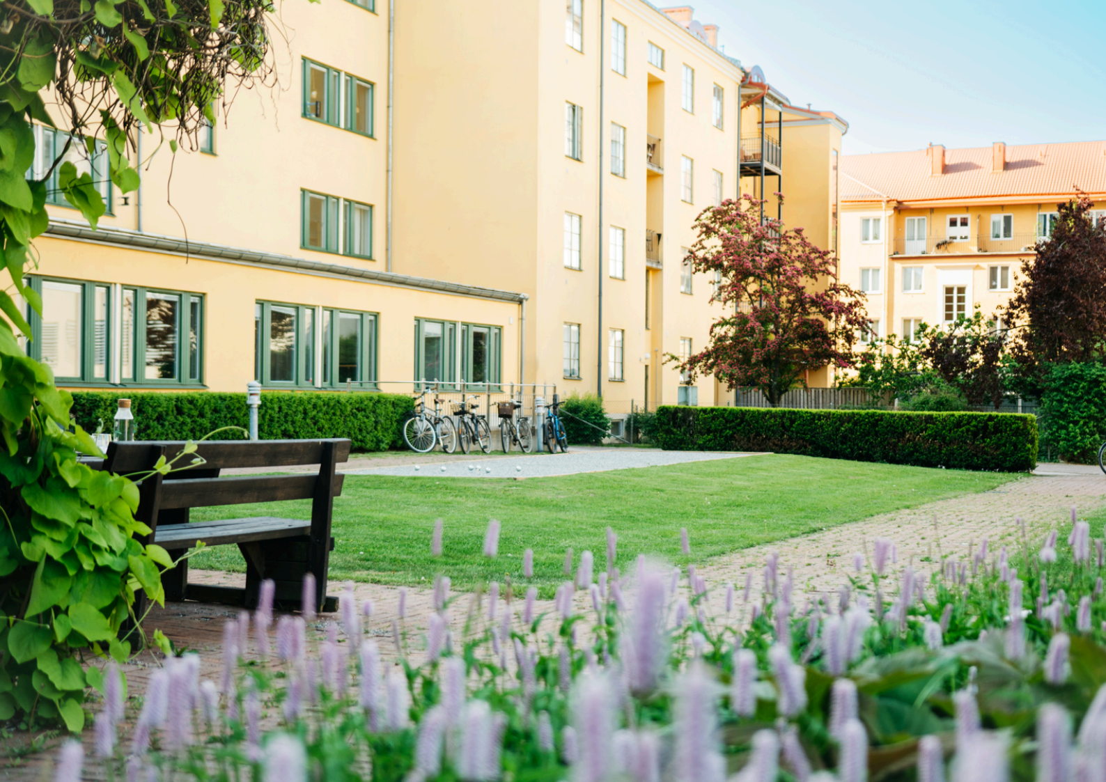
VY FRÅN TERRASS