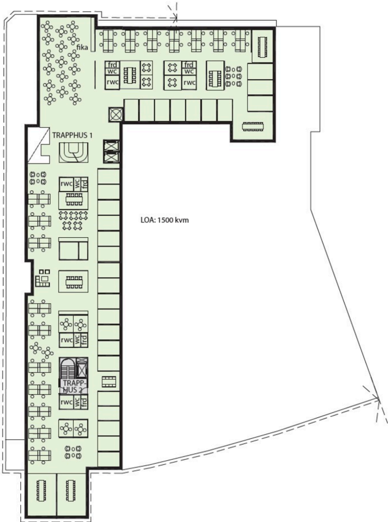
KONTOR - EN HYRESGÄST