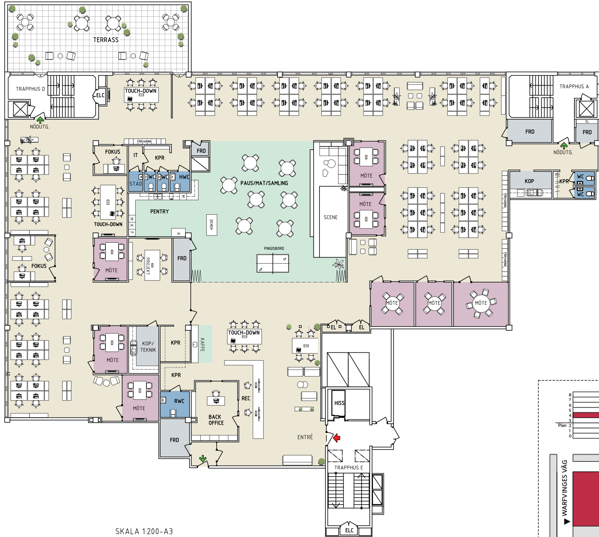
SKALA 1:200-A3 0 1 5 7,5 m