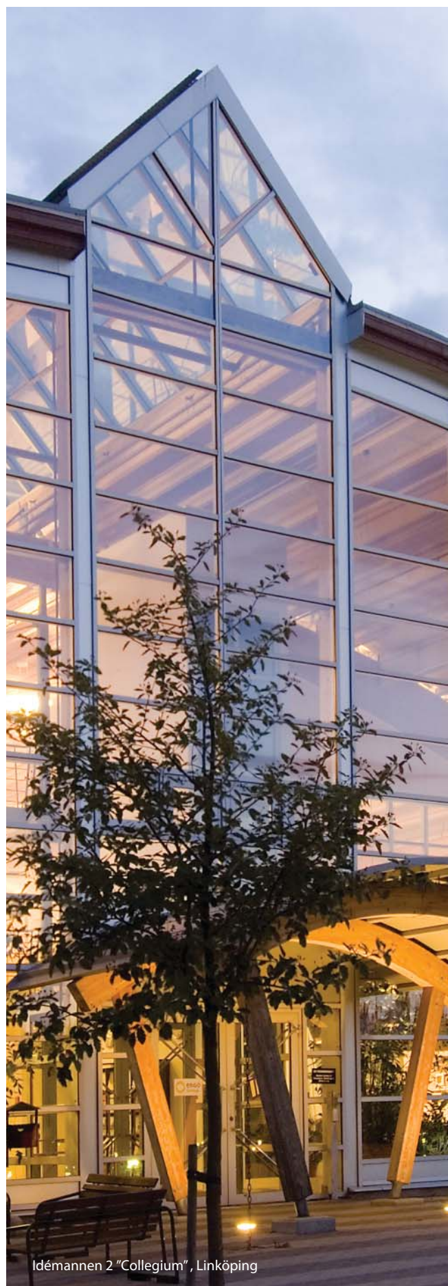
Idémannen 2 "Collegium", Linköping

Styrelsemöten hålls i anslutning till bolagets rapportering, varvid årsbokslut och förslag till vinstdisposition behandlas i januari, delårsbokslut i april, juli och oktober samt budget för nästkommande år vid december månads möte.