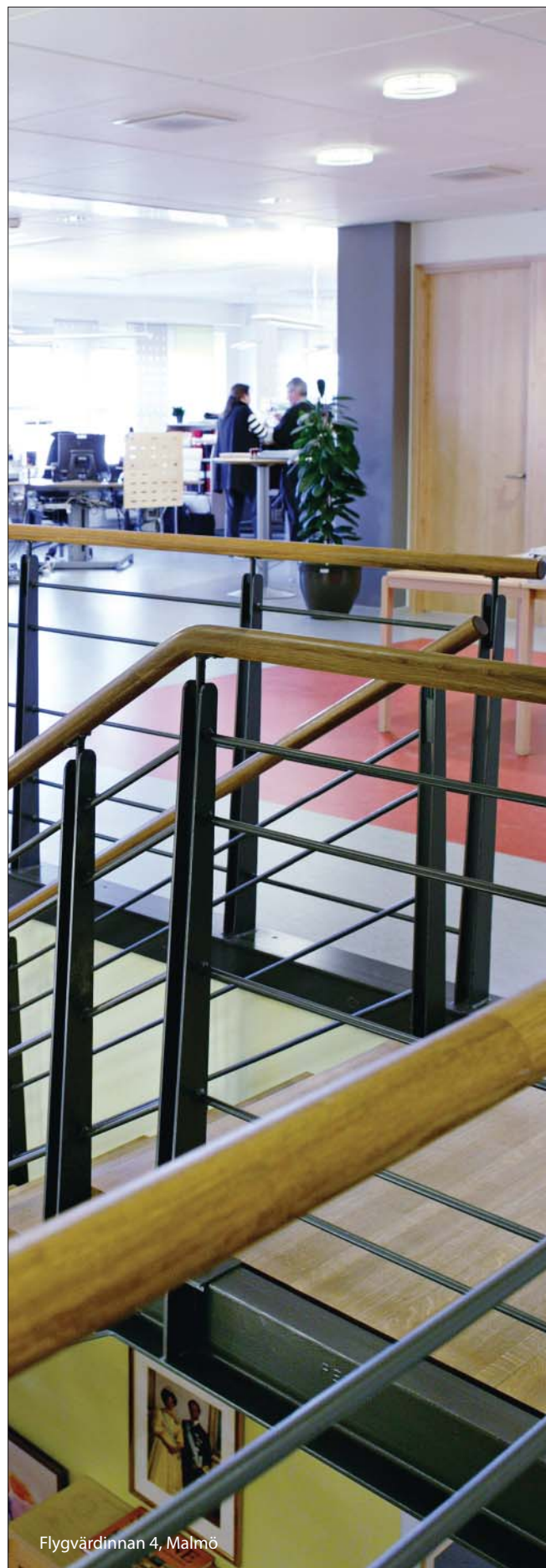
Flygvärdinnan 4, Malmö

Castellum har en småskalig organisation med ca 25-35 anställda i respektive bolag vilka tillsammans förvaltar drygt 500 kostnadsställen. All verksamhet bedrivs i dotterbolagen medan finansverksamheten bedrivs i moderbolaget, innebärande att Castellum AB inte utgör ett profit-center. Detta medför att ekonomifunktionen i moderbolaget utgör controllerfunktion gentemot dotterbolagen samt compliance officer-funktion gentemot finansavdelningen. Sammantaget medför detta att det inte anses föreligga behov av en särskild enhet för internrevision.